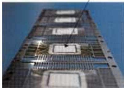
リードフレーム上にICチップを接着させます