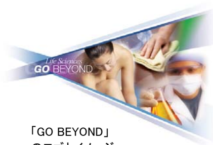
「GO BEYOND」 のロゴとイメージ

※1:ビューティー/パーソナルケア www.dowcorning.co.jp/content/personal/ ヘルスケア www.dowcorning.co.jp/content/healthcare/ ハウスホールドケア www.dowcorning.co.jp/content/household/