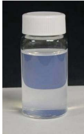
写真は FB-2539 を使用し、当社にて試作した微濁化粧水のサンプル